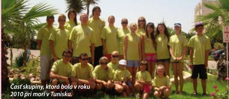
Časť skupiny, ktorá bola v roku 2010 pri mori v Tunisku.

Dia deti poznajú aj roklíny v Slovenskom raji.