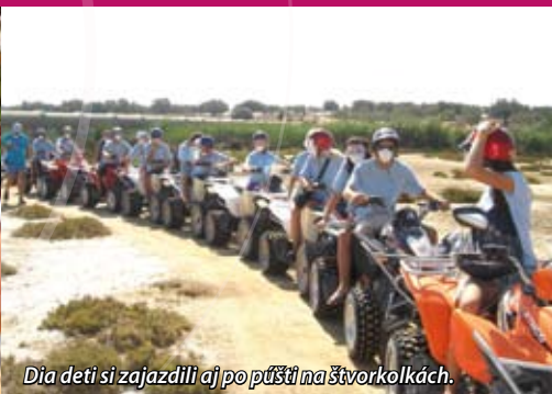
Dieťa si zajazdili aj popúšťa na štvorkolkách.