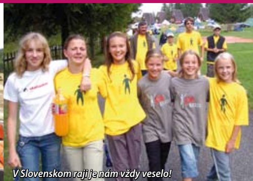
V Slovenskom raji je nám vždy veselo!

Od 10. 11. 2005 sme získané skúsenosti a rady zo života s detským diabetom začali šíriť aj prostredníctvom internetového časopisu. Postupne sa zmenil tak, že všetky dôležité informácie o činnosti Zdrúženia a o našich skúsenostiach so životom s diabetom si môžete prečítať a pozrieť na Spišiačikovi, teda: www.spisiacik.sk .