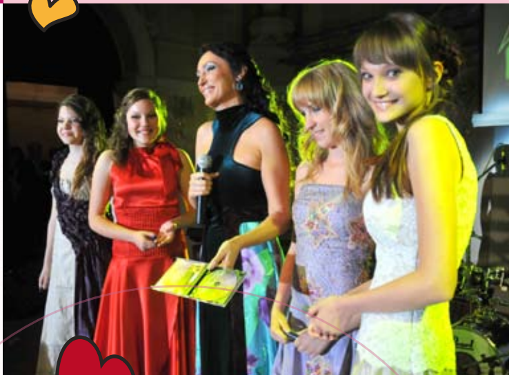
Dievčatá s diabetom krstili aj CD Sisy Sklovskej.

J. Wolkera 31/14, 052 05 Spišská Nová Ves, tel.: 0905 331 892 IČO: 35547782, DIČ: 2021683521, č. účtu: 5432881/5200 e-mail: spisiacik@spisiacik.sk