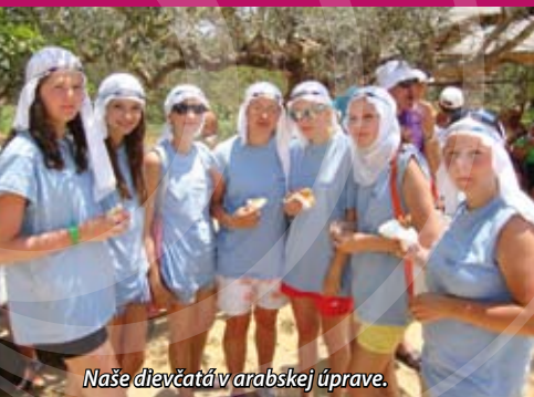
Naše dievčatá v arabskej úprave.